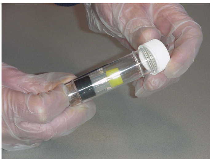
Stap 10: Schroef de witte dop weer op de verzendkoker

Opmerking: de opeenvolgende series buisjes zullen een afwijkende kleur hebben om vergissing tijdens het wisselen te voorkomen. Zie voor de juiste kleur de achterzijde van het invulformulier.