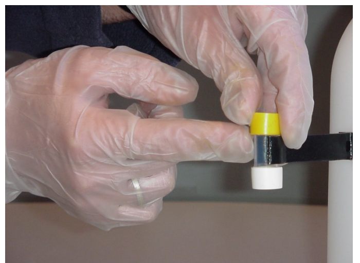
Stap 9: Op het buisje zit een barcode. Plaats het nieuwe meetbuisje zodanig in de houder dat de barcode aan de dichte zijde van de houder zit. Let er ook op dat de witte kant van het meetbuisje aan de onderzijde zit.