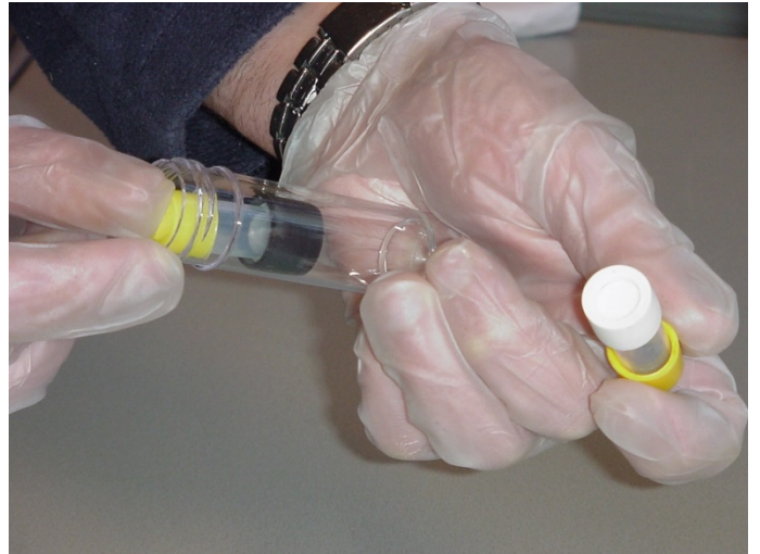
Stap 8: Plaats het gebruikte meetbuisje in de verzendkoker.