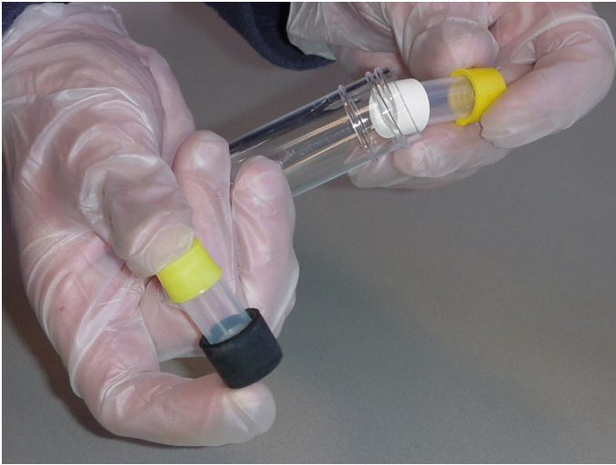
Stap 7: Haal het nieuwe meetbuisje weer uit de verzendkoker.