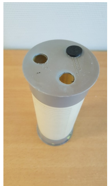
Houder met geplaatst buisje

Wanneer in de houder al buisjes aanwezig zijn, dan worden eerst deze buisjes uit de houder gehaald en worden de gebruikte buisjes afgesloten met de gele dopjes die afkomstig zijn van de nieuwe buisjes. De nieuwe buisjes worden daarna in de houder geplaatst.