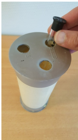
Plaatsing buisje in houder (zonder gele dopje)