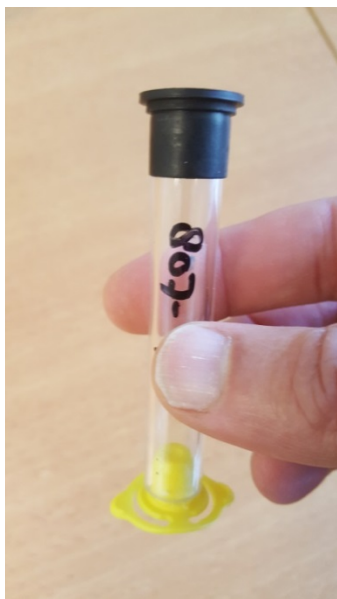
Buisje afgesloten met gele dopje

OPMERKING: er zijn houders met 2 tot 5 gaten in omloop. Indien u een exemplaar heeft met meer dan 2 gaten, dan maakt het niet uit in welke van de gaten de buisjes worden geplaatst.